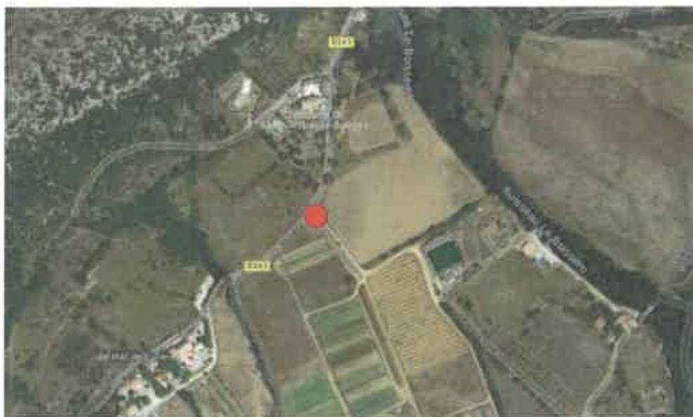
● Localisation de la caméra au centre de tri sur la commune de ST André de la Buèges